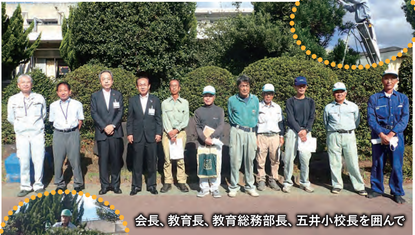
会長、教育長、教育総務部長、五井小校長を囲んで