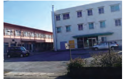
(株)トマック姉ヶ崎寮

姉ヶ崎駅より徒歩約10分、当センターの近くの就業場所で、女性4名と男性1名の計5名(厨房作業 女性1名、清掃作業 女性3名、男性1名)が就業しています。