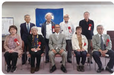
会長を囲んで表彰者の皆さん