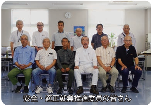
安全・適正就業推進委員の皆さん