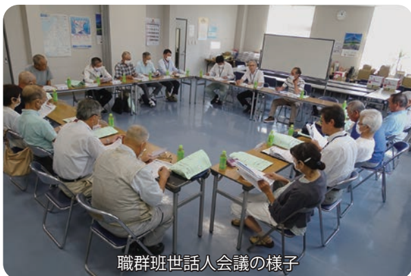
職群班世話人会議の様子