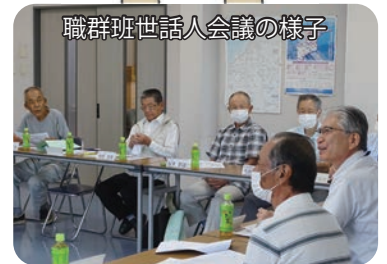
職群班世話人会議の様子