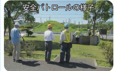
安全パトロールの様子