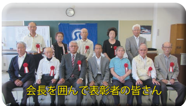
会長を囲んで表彰者の皆さん